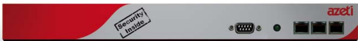
Abbildung: azeti 3000

RED BLOXX TECHNOLOGY Made in Germany by azeti.